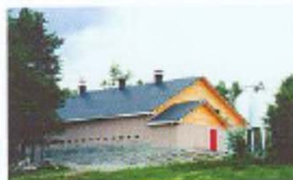
Las características higiénicas del sistema son

Componentes del sistema: A- Perfil de atado entre paneles. B- Núcleo de lana mineral de fibras orientadas. C- Perfiles perimetrales machihembrados. D- Placas de GRP con acabado acrílico. E- Perfil base de GRP atornillado al suelo.