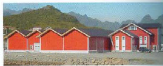
Beet resiste condiciones climáticas extremas. Planta procesadora de pescado

transporte y montaje, ofrece resistencia al impacto y resistencia suficiente para soportar estructuras de cubierta. El sistema es desmontable.